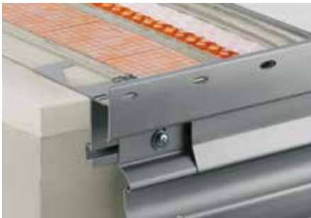
Mise en œuvre du Schlüter®-BARA-RTKE avec Schlüter®-DITRA-DRAIN 4