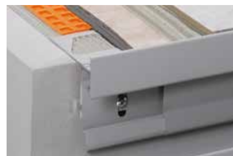
Mise en œuvre du Schlüter®-BARA-RTKEG avec Schlüter®-DITRA 25