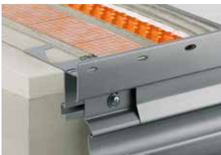
Mise en œuvre du Schlüter®-BARA-RTKE avec Schlüter®-DITRA-DRAIN 8

Nota : des angles rentrants et sortants font partie de la gamme. Les extrémités des profilés et des angles doivent être aboutées en laissant un espace de 5 à 10 mm pour permettre la dilatation due aux écarts de température. Déposer un cordon de Schlüter-KERDI-FIX sur le profilé de part et d'autre de cet espace et recouvrir par un raccord clipsable. Observer les recommandations de mise en œuvre des fabricants et les normes en