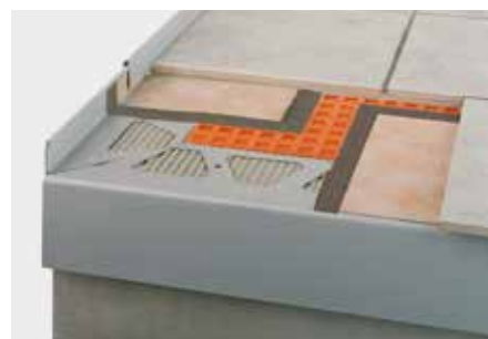
Tableau 1 :