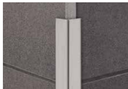
Schlüter-ECK-K 15 EB