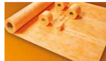
Schlüter®-KERDI Une étanchéité fiable rapide à mettre en œuvre