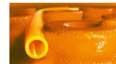
Schlüter®-BEKOTEC-THERM Le plancher chauffant-rafraîchissant