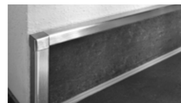
Schlüter®-RONDEC, -JOLLY et -QUADEC Profilés pour la finition et la protection d'angles carrelés