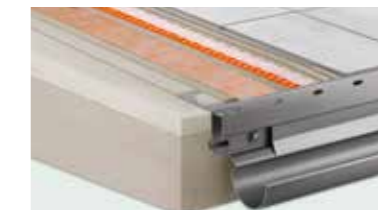
Systèmes pour balcons Schlüter® Solutions complètes pour la construction et la rénovation de balcons et de terrasses