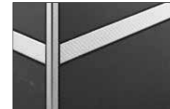
Acier inoxydable structuré design ES 1