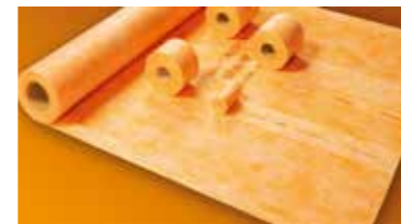
Schlüter®-KERDI Une étanchéité fiable en quelques instants