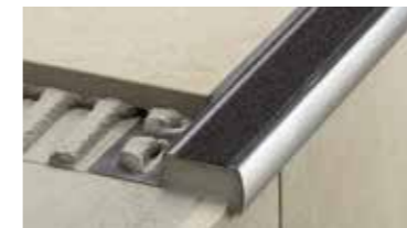
Schlüter®-TREP Profils antidérapants pour escaliers