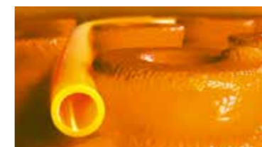
Schlüter®-BEKOTEC-THERM Le plancher Thermo-Ceramic®