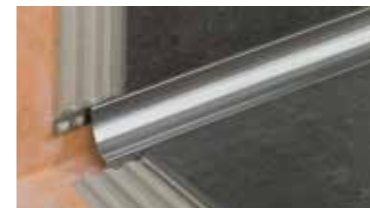
Schlüter®-DILEX Système de profils pour des joints de fractionnement et périphériques ne nécessitant pas d'entretien

Vous souhaitez découvrir d'autres produits et solutions système Schlüter pour la pose de revêtements carrelés ? Les brochures suivantes sont disponibles chez nos partenaires commerciaux. Vous trouverez également de plus amples informations sur notre site Internet à l'adresse www.schluter-systems.fr