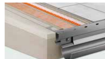
Systèmes pour balcons Schlüter® Solutions complètes pour la construction et la rénovation de balcons et de terrasses