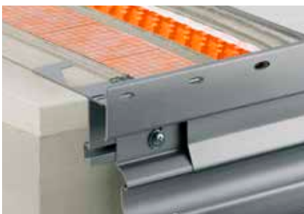
Mise en œuvre du Schlüter®-BARA-RTKE avec Schlüter®-DITRA-DRAIN 8