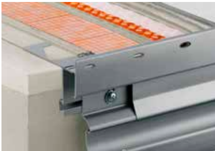
Mise en œuvre du Schlüter®-BARA-RTKE avec Schlüter®-DITRA-DRAIN 4