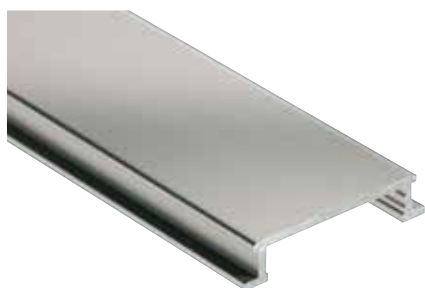
Schlüter®-DESIGNLINE-AME anodisé mat (-AT)