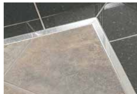
Schlüter®-DESIGNLINE-E au sol