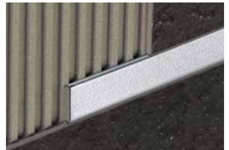
Schlüter®-DESIGNLINE-ES Design 2