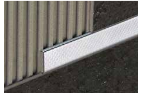
Schlüter®-DESIGNLINE-ES Design 1